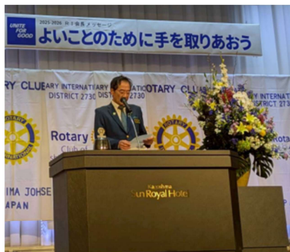
△西本ガバナー挨拶