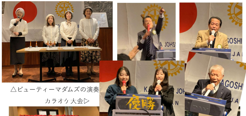
△ビューティーマダムズの演奏 カラオク大会▷