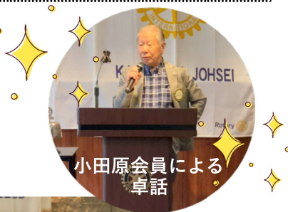
小田原会員による卓話