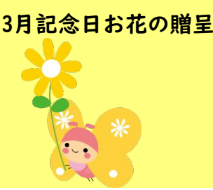
3月記念日お花の贈呈