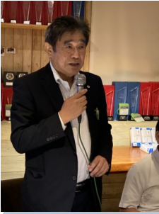
チャーターメンバー による卓話