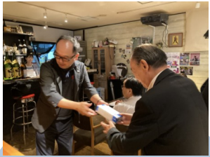
23-24年度 出席100%表彰（記念品 シヤチハタ印鑑）