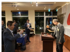
乾杯(上之園会長エレクト)