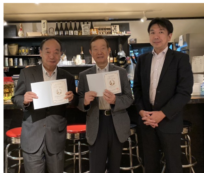
米山奨学金授与 (7月)