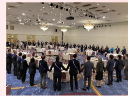
最後は全員輪になって 「手に手つないで」↓