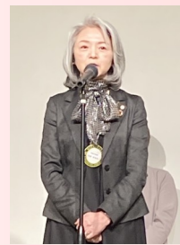
↑次年度会長・幹事挨拶